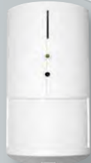
Bewegung und Kamera