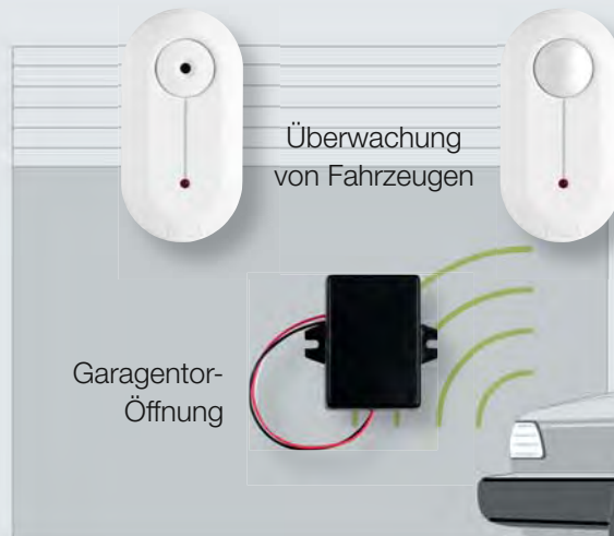
Überwachung von Fahrzeugen