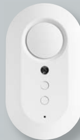
Hineinhören und -sprechen aus der Ferne