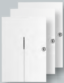
Funkausgangs- schalter (für Heizung, Licht, Rollläden, ...)